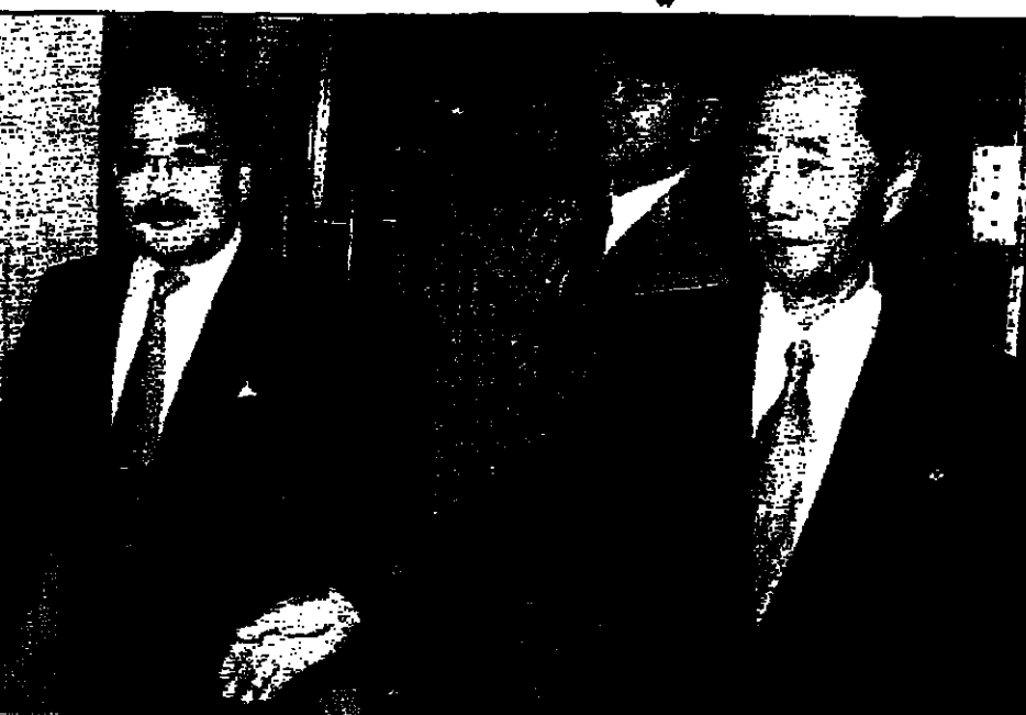
رئيس وفد كوريا الشمالية (يمين) يرحب برئيس وفد اليابان لدى وصوله سفارة بيونغ يانغ في بكين أمس